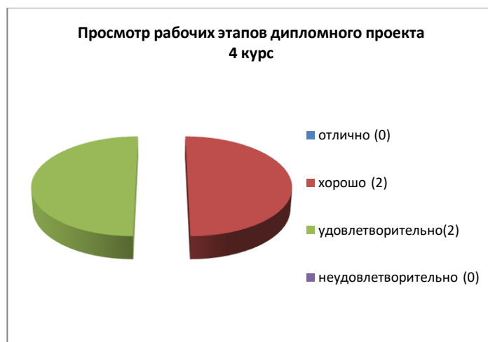
Диаграмма демонстрирует количество оценок за этапы дипломного проекта.